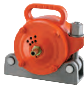
NVT 87 mit Halterung NVH 4