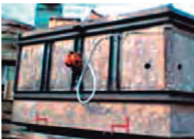
Verdichten von Formsand

Halterungen zu diesen Vibratoren finden Sie auf unserem Datenblatt.